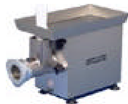
X 70 / X 70 G / XS 132 / XT 132